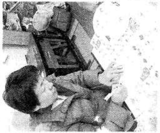
井戸水の測定をする静岡放射能汚染測定室のスタッフ(静岡市駿河区)