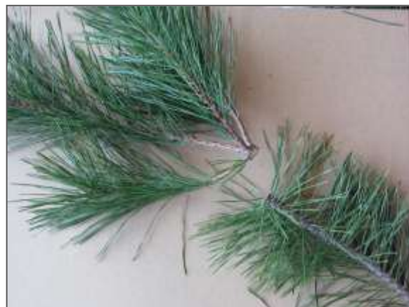
松葉の新旧(左上：新葉 H23、右下：旧葉 H22)