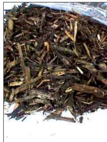
島田市で試験焼却された瓦礫の一部

この瓦礫をテレビ報道で観た方もあると思いますが、内容はご覧のように細かい木材チップです。