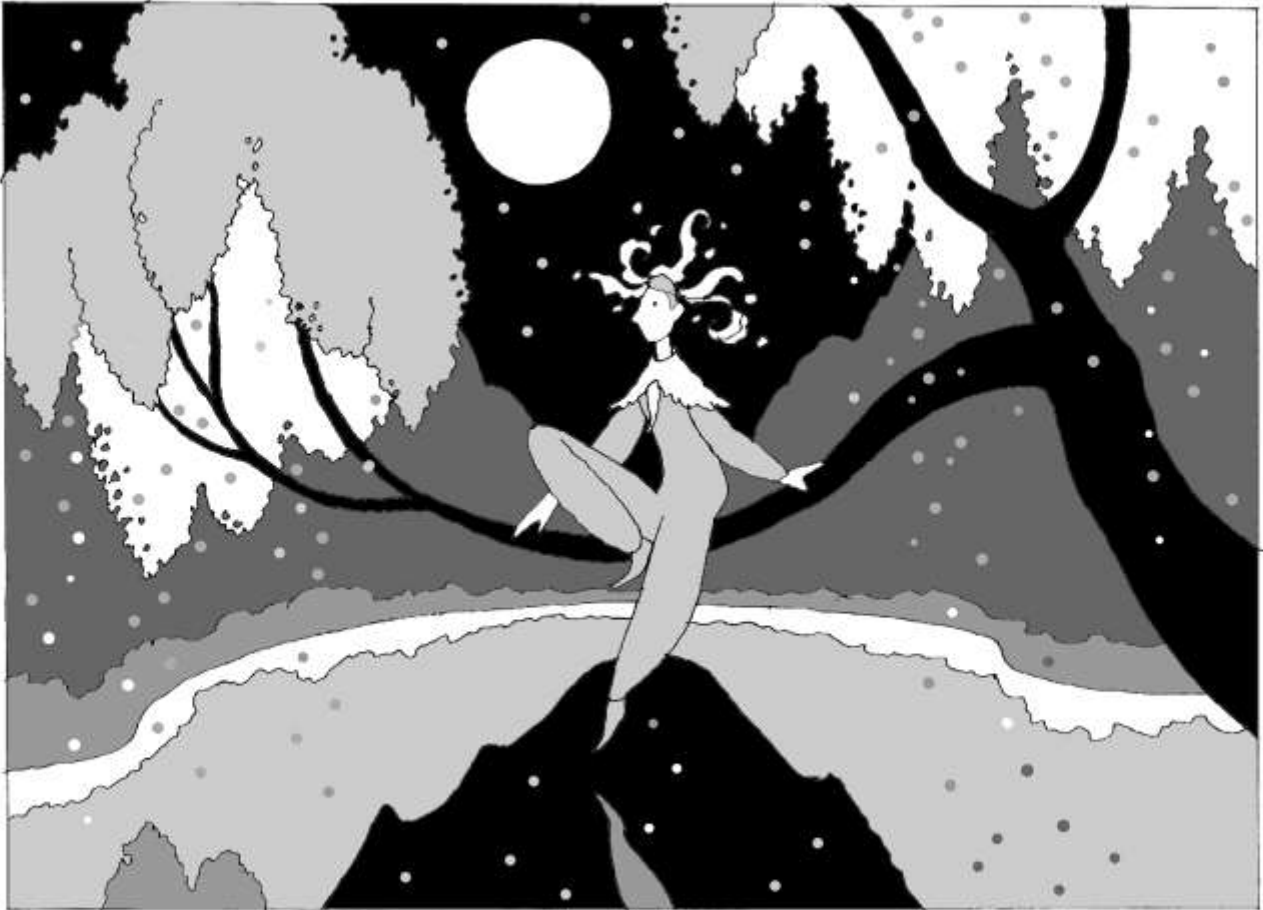
イラスト 清重伸之