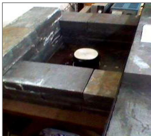
現在使用中の 測定器内部写真

静岡と高価格のものはNaIの大きさは標準といわれる3インチ、低価格の方は2.5インチである。同じNaI結晶なら検出効率は大きいほうが良いが、この大きさの違いはあまり選択上大きなことではない。使用部品に耐久性、高信頼性、高精度のものを使ったり、バックグラウンド低減対策に特別なホトマルを使ったり、特別な内張りなどを施せば、自ずと高価になる。